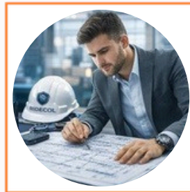
Ingeniería y Proyectos